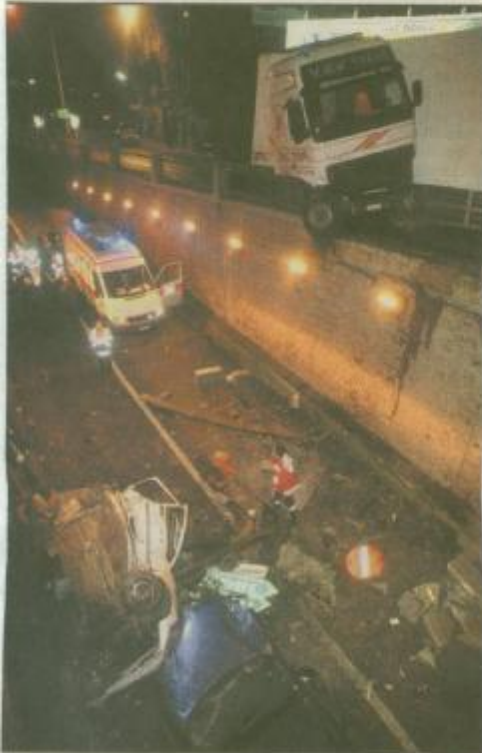
Dimanche soir, deux policiers liégeois ont perdu la vie dans un accident. Leur véhicule, après avoir été percuté par un camion, a été lancé contre plusieurs poteaux de signalisation